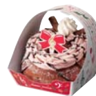
※ドーナツリース ベリー× いちごクリーム