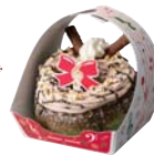
※ドーナツリース 抹茶× マロンクリーム