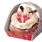
※ドーナツリース ベリー× チーズクリーム