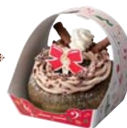
※ドーナツリース 抹茶× チョコクリーム